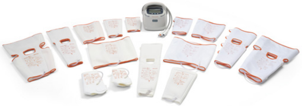
Flowtron® system för aktiv kompression