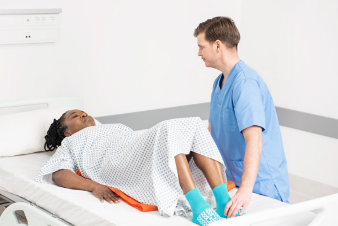
Fysioterapeut som mobiliserar en patient i sängen